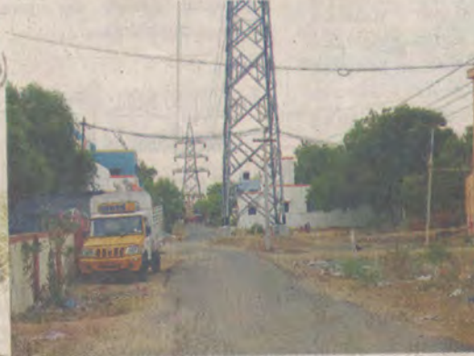
ஆத்திப்பட்டி ஊராட்சிக்குள்பட்ட நாராயணபுரத்தில் மின்விளக்குகள் அமைக்கப்படாத பொதிகை வீதி.

அருப்புக்கோட்டை, ஜூலை 2: விருதுநகர் மாவட்டம் அருப்புக்கோட்டை வட்டம் ஆத்திப்பட்டி கிராமம் நாராயணபுரம் பகுதியில் தெருவில் மின்விளக்குகள் அமைக்கப்படாததால், பொதுமக்கள் அவதிப்பட்டு வருகின்றனர்.